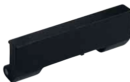
Přídavné ocelové čelisti